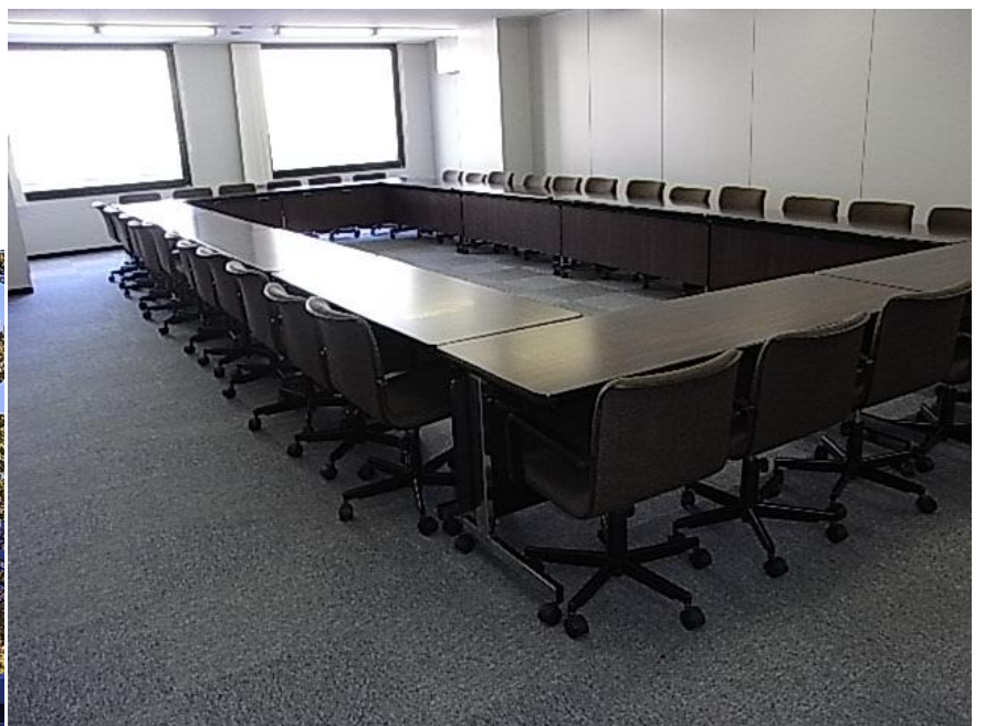
302 会議室 (窓の外に横浜港を望む)